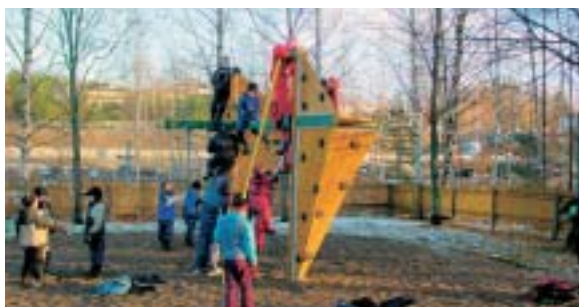
Keljon koulun pihaleikkiväline sai heti käyttäjät ympärilleen

viimeisellä viikolla ensimmäiset pihaleikkivälineet. Pihojen suunnittelu- ja toteutustöitä jatketaan talven taituttua eli kevään ja kesän 2004 aikana.