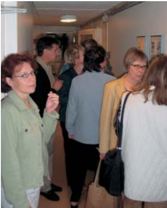
Välillä tilojemme käytävillä vallitsi melkoinen ruuhka.