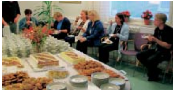
Yhdessä vieraidemme kanssa nautimme kahvipöydän antimista ja menneiden muistelemisesta.