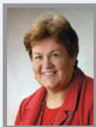
Maritta Lahti terveydenhuollon palvelut, vanhus- ja vammaispalvelut

Puh. (014) 266 8235 050 581 3683 (68235) anu.hakala@jkl.fi