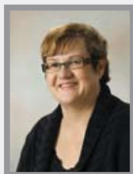
Anu Hakala päivähoitopalvelut, sosiaali- ja perhepalvelut

Puh. (014) 266 8230 0400 807 598 (68230) satu.alten@jkl.fi