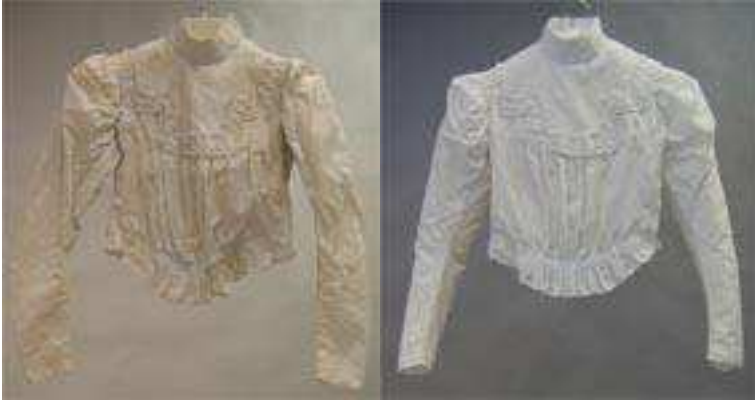
Hääpuvun jakku ennen ja jälkeen konservoinnin.