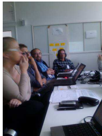
Oikealla: Kokonaisarkkitehtuuryöryhmä kokousta 27.8.2012.