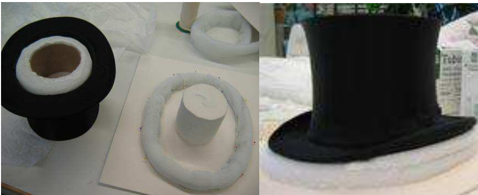
Silinterin säilytystuki.

Konservoituja ja pestyjä ryijyjä oli useita; vanhimmat, komeat kansanomaiset ryijyt 1800-luvulta, uudemmat sisustusryijyt 1900-luvun alkupuoliskolta, jolloin suosittuja ryijymalleja valmistettiin sekä kutomalla että pohjakankaalle ompelemalla. Tekstiilitaiteilija Sirkka Könösen vuonna 1994 suunnittelema paksunukkainen vihkirijyy edusti modernia ryijytaitetta, jossa ryijynukitukseen saatetaan yhdistää muitakin kudonta- ja tekstiilitekniikoita.