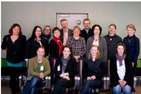
Vasemmalla: Luettelointityöryhmä koolla 19.4.2012.