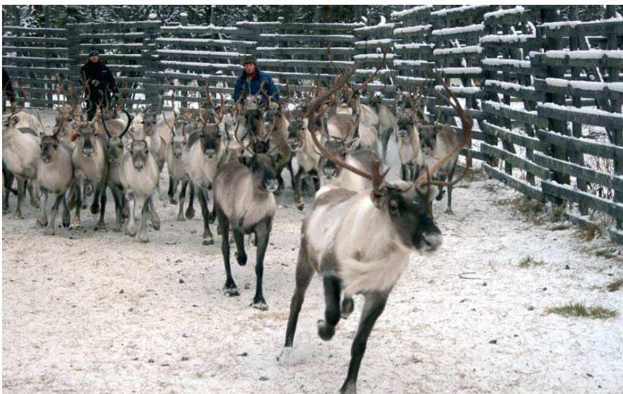
Kuvassa poroerotus Vuotsolla lokakuussa 2006.

Suomen käsityön museon tuot- tama, koko perheelle suunnattu vuoden päänäyttely kertoi pohjoisen poronhoitoalueen käsityöläisistä ja porosta monipuolisena aiheena, ide- ana ja käsityömateriaalina. Poron jäl- jillä -näyttely johdatteli kävijät poron ja poronhoidon maailmaan, jossa poro esiteltiin biologisena eläimenä sekä ihmisen paimentamana hyötye- läimenä.