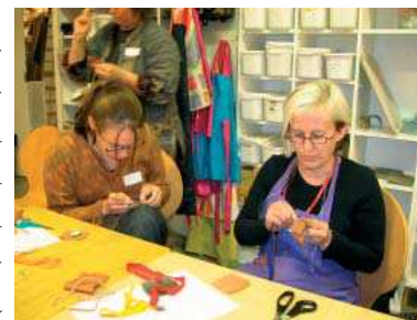
Porokoulu/ Suomen käsityön museo

Ryijyseminaari järjestettiin yhteistyössä Jyväskylän yliopiston opettajankoulutuslaitoksen ja Jyväseudun kansalaisopiston kanssa. Jyväseudun kansalaisopiston kanssa järjestettiin myös 4 muuta käsi- ja taideteollisuusalan luentoja. Luovan Foorumin kanssa järjestettiin Luomisen tunne -luento tammikuussa.