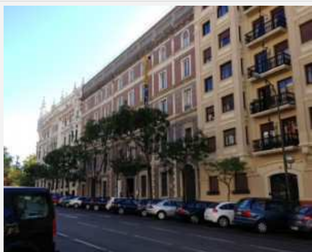
Tässä etätyöpaikkani, keskellä tummempi rakennus, jossa jokin viiri seinässä. Sama ongelma tälläkin museolla kuin meillä eli museo ei oikein erotu katukuvasta

Tänään menin heti aamusta tutustumaan nykyiseen etätyöpaikaani, joka on Museo Nacional de Artes Decorativas osoitteessa Montalbán 12, Madrid. Minulle on kerrottu, että se on Espanjan Designmuseo. Kyllähän niissä jotain samaa on, mutta kuitenkin ne ovat pikasilmäyksellä ihan erilaiset Suomen Designmuseoon verrattuna. Ehkä täällä on museoiden kulttuurinen perspektiivi jonkin verran vanhempaa kuin Suomessa. Eka vierailu oli mielenkiintoinen, sillä vaikka olemme suunnitelleet NowHere Finland 2012 -näyttelyn esittelyä täällä Madridissa jo kohta vuoden, nyt olin ensimmäistä kertaa suoraan yhteydessä museon henkilökuntaan. Tähän asti kaikki yhteydenpito on hoidettu Suomen Madridin instituutin tai Suomen Espanjan suurlähetystön välityksellä. Todennäköisesti tähän on ollut se syy mitä epäilinkin eli täällä ei juurikaan osata englantia. Osa museon infon henkilökunnasta ymmärsi jotain, mutta he vastasivat espanjaksi, mitä minä ymmärsin vielä vähemmän. Otin taksikuskin opettaman metodin käyttöön ja huitomalla selvitin, millaiset kulkureitit yleisöllä tilassa yleensä. Viime viikolla minun piti ilmoittaa museolle passini numeron, mikäli menen sinne jo sunnuntaina töihin. Jos minulta tänään kysyttiin passia, en sitä ainakaan ymmärtänyt, mutta molemmat aulaassa partioivat miesvartiat olivat ihan ystävällisiä, joten asia lienee ollut kunnossa.