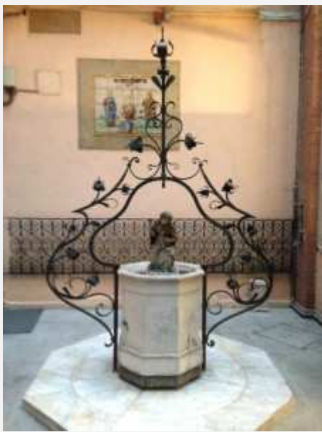
Katetulla sisäpihalla on tällainen "kaivo", jossa lienee joskus ollut vihkivettä.

P.S. Museon infon vieressä on verholla peitetty oviaukko. Tänään kävin sieltä etsimässä äänentoistolaitteita ja meinasin lentää selälleni hämmästyksestä. Verhon takana oli pieni käytävä, josta lähti portaat alakertaan. Siellä oli pieni kappeli, jonka seinät ja alttari olivat kuvioitua nahkaa. Siellä oli kaikki kirkon vermeet paikoillaan alttaritaulua, puoliksi palanetia kynttilöitä ja upeita kalusteita myöten. Rakennus lienee ollut jonkun rikkaan perheen koti ja paikka heidän kotikirkkonsa. Nyt siellä oli museon isoja tekstiilirullia ja designtuoleja 1900-luvulta kankaiden alla. Sama tilanahtaus tuntuu kotoisalta. Meilläkin kaikki mahdolliset nurkat on otettu tehokäyttöön. Yritän huomenna ottaa sieltä kuvia. Melkoinen Tylypahka museoksi.