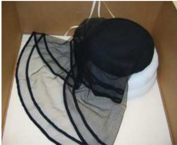
Suruhattuke rnakakultan äyttäväntu kensap äälläs äilytyslaatikossa.

Tuet onnistuivat kuitenkin loppujen lopuksi todella hyvin ja nyt hatut ovat valmiita säilytykseen tai näyttelyyn. Hattutuet täyttävät tehtävänsä päähineiden säilytyksessä.