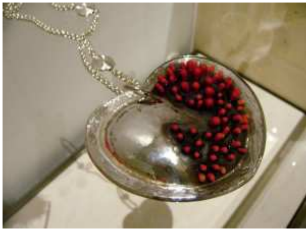
Tässä korussa on tulta – ja tulitikkuja!