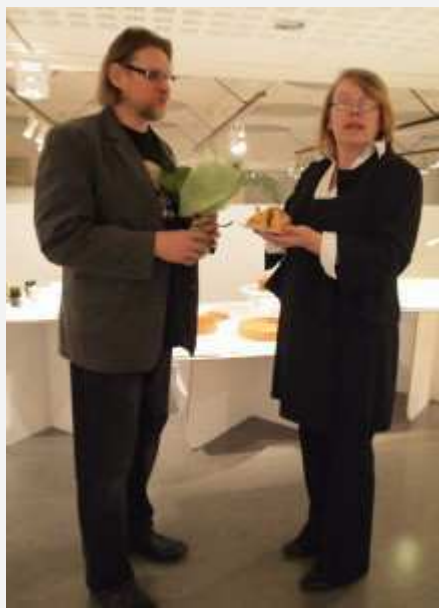
Torstenssoneilla on kierrätyslasiyriitys Kiikoisissa.

aluksi taittelemalla paperista hahmomalleja. Varjostinta voidaan varastoida ja kuljettaa litteinä pelteinä, ja se taitellaan muotoonsa kuin origami.