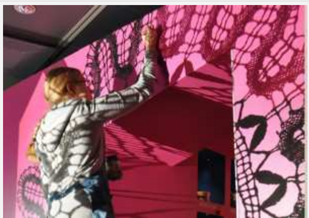
Aistitila saa uuden pitsimaalauksen

Ensin olin Suomen Kansallispukekukseksella auttamassa näyttelyjen vaihdossa. Pakatessani kansallispukuja huolellisesti silkkipaperiin käärittyinä pukulaatikoihin pääsin ihaillemaan pukujen upeita yksityiskohtia; kirjailuja, revinnäisiä ja käsin kudottuja kankaita. Voi sitä käsityötaitoa ja aikaa mitä kansallispuokujen valmistaminen vaatii! Pääsin myös tutustumaan kokoelmakeskuksen tiloihin ja Konservointikeskukseen, kun olin mukana hakemassa pukuja uutta Kärpäset ja linnunsilmät -näyttelyä varten.