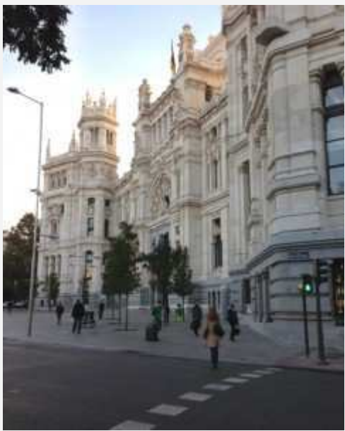
Tässä maamerkkejäni työmatkan varrelta. Lienee jokin hallintokorttelin ministeriöistä.