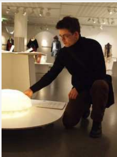
Airbag-valaisin on valmistettu auton turvatyynyistä.

NowHere Finland 2012 -näyttely on alueellisten taidetoimikuntien yhteistyön tulosta ja esittelee ajankohtaista ympäristönmyötäistä muotoilua Suomessa. Näyttely on Suomen käsityön museon tuottama ja se nähdään Jyväskylässä 13.5.2012 saakka, Savonlinnan maakuntamuseossa 15.6.-26.8.2012 ja Lahden Sibeliustalon Puusepän verstaassa 4.-22.9. Sen jälkeen näyttely suuntaa Madridiin.