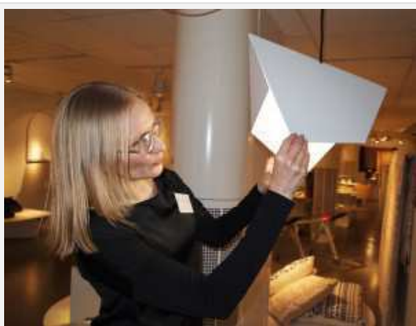
Sanomalehden painopellistä taiteltu Renew's-valaisin kierrättää uutisia.