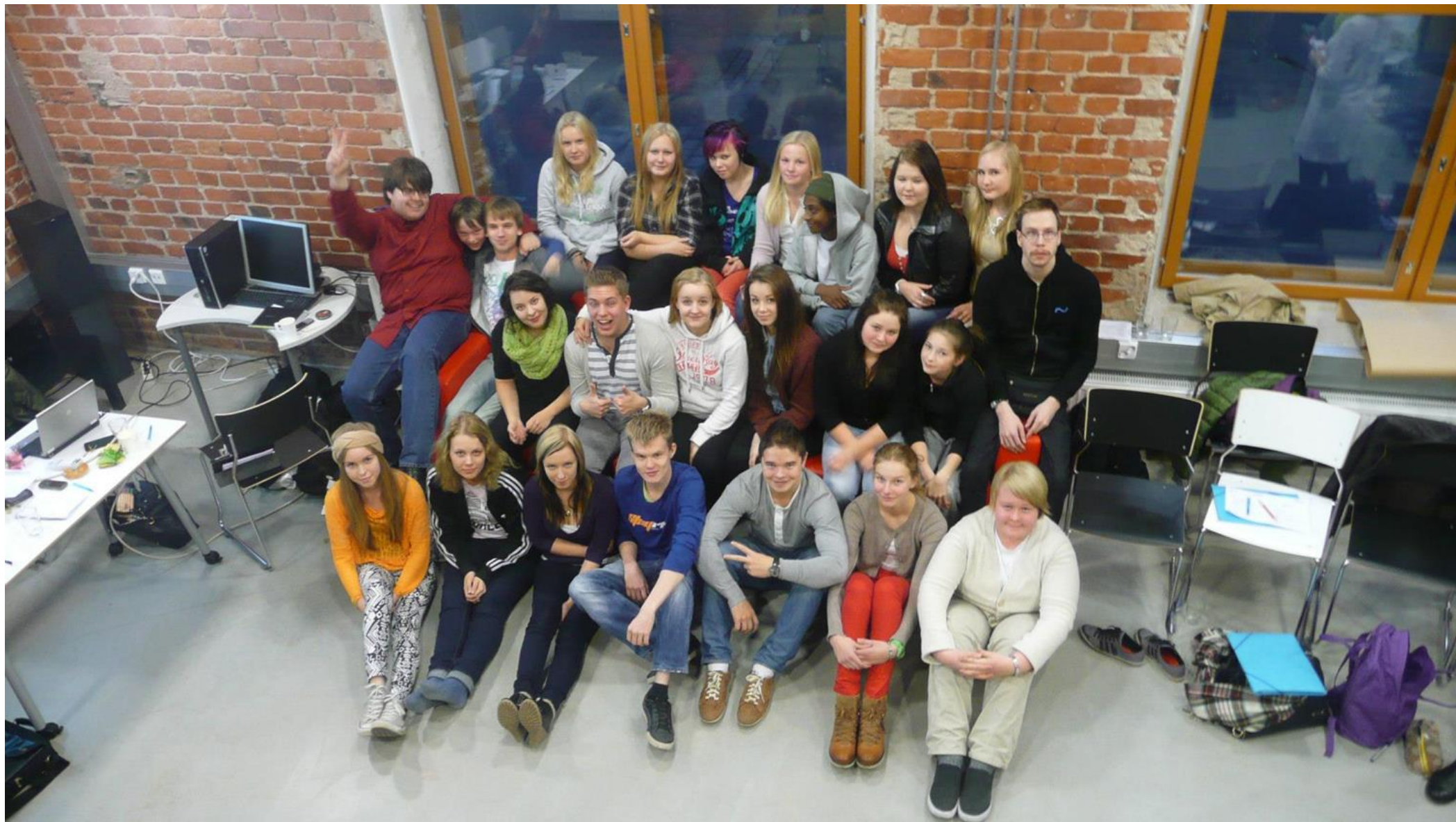
Nuorisovaltuutettu kaudelta 2012-2013