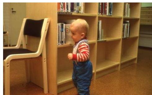
Harjoitteleva kirjastonkäyttäjä Keltinmäessä 18.10.1983. Hyllyissä on vielä runsaasti tyhjää tilaa. Taustalla näkyy osa kortistolaatikkokostosta. Ennen tietokantoja aineistoa etsittiin kortistojen avulla.