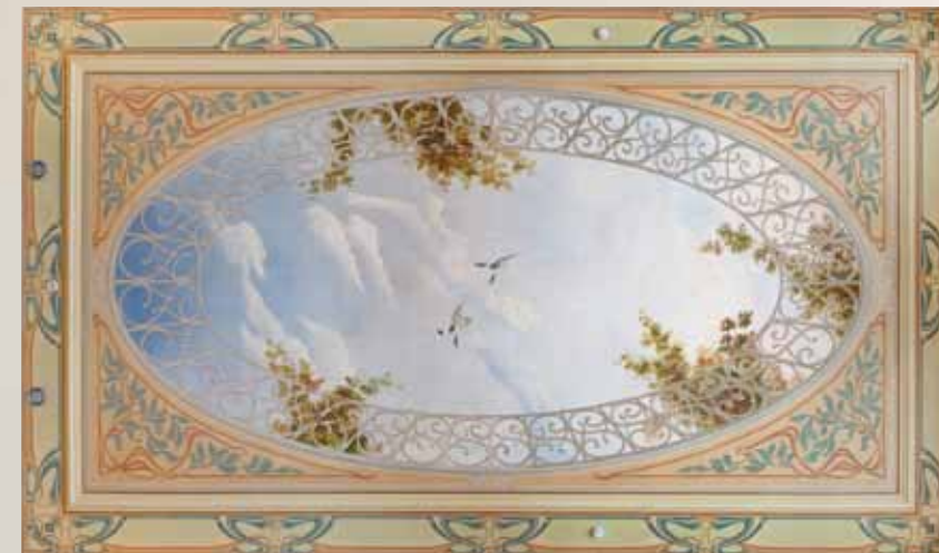
Paraatiportaikon kattomaalaus.