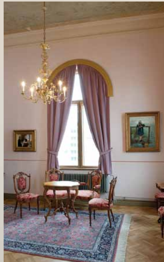
Naisten sali.