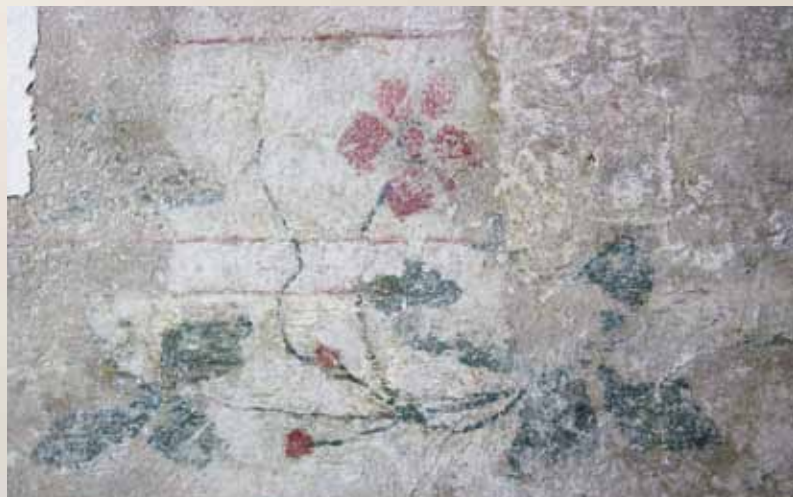
Osa alkuperäistä kattomaalausta. RM