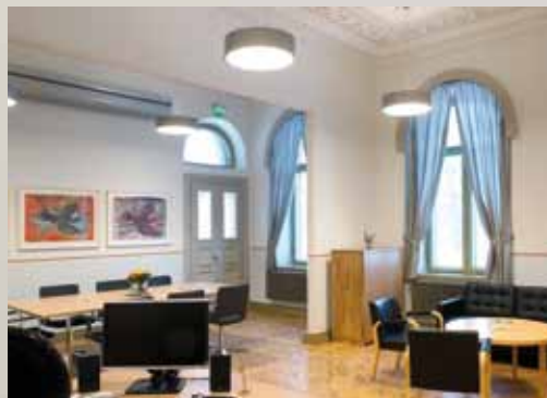
Kaupunginjohtajan huone. MH