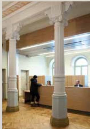
Kaupungintalon neuvonta. MH