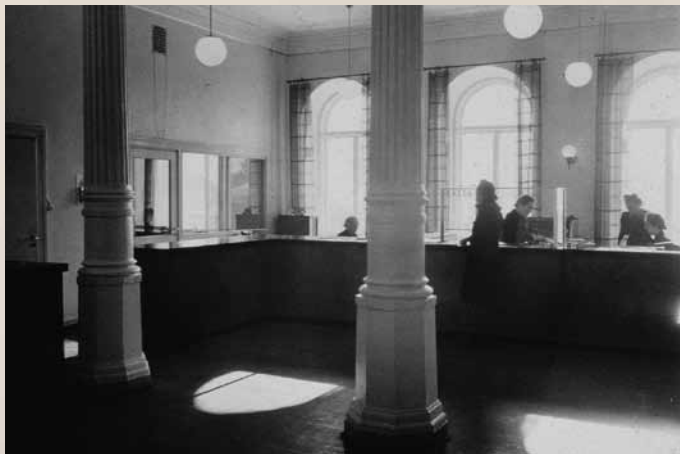
Kaupungin rahatoimisto 1940-luvulla. KSM

Peruskorjauksessa taloon palautettiin alkuperäinen huonejako ja entisöityihin tiloihin alkuperäinen värimaailma, kipsilistat, koristemaalaukset ja kokopuiset peiliövet. Vanhat massiivipuiset kalusteet ja arvovalaisimet on kunnostettu ja palautettu takaisin käyttöön. Toimistotiloissa on uudet kalusteet ja huoneiden valaisinvalinnoissa on korostettu 2000-lukua uudenaikaisilla valaistuksilla ja muodoilla ja metallinvärillä.