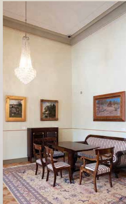
Herrain sali. MH