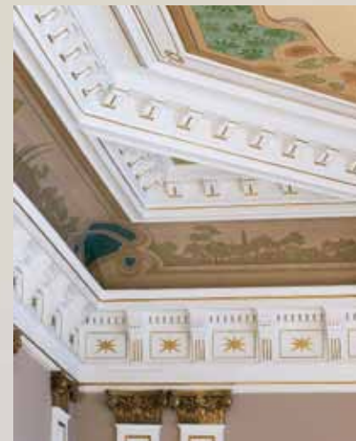
Yksityiskohta juhlasalista. MH