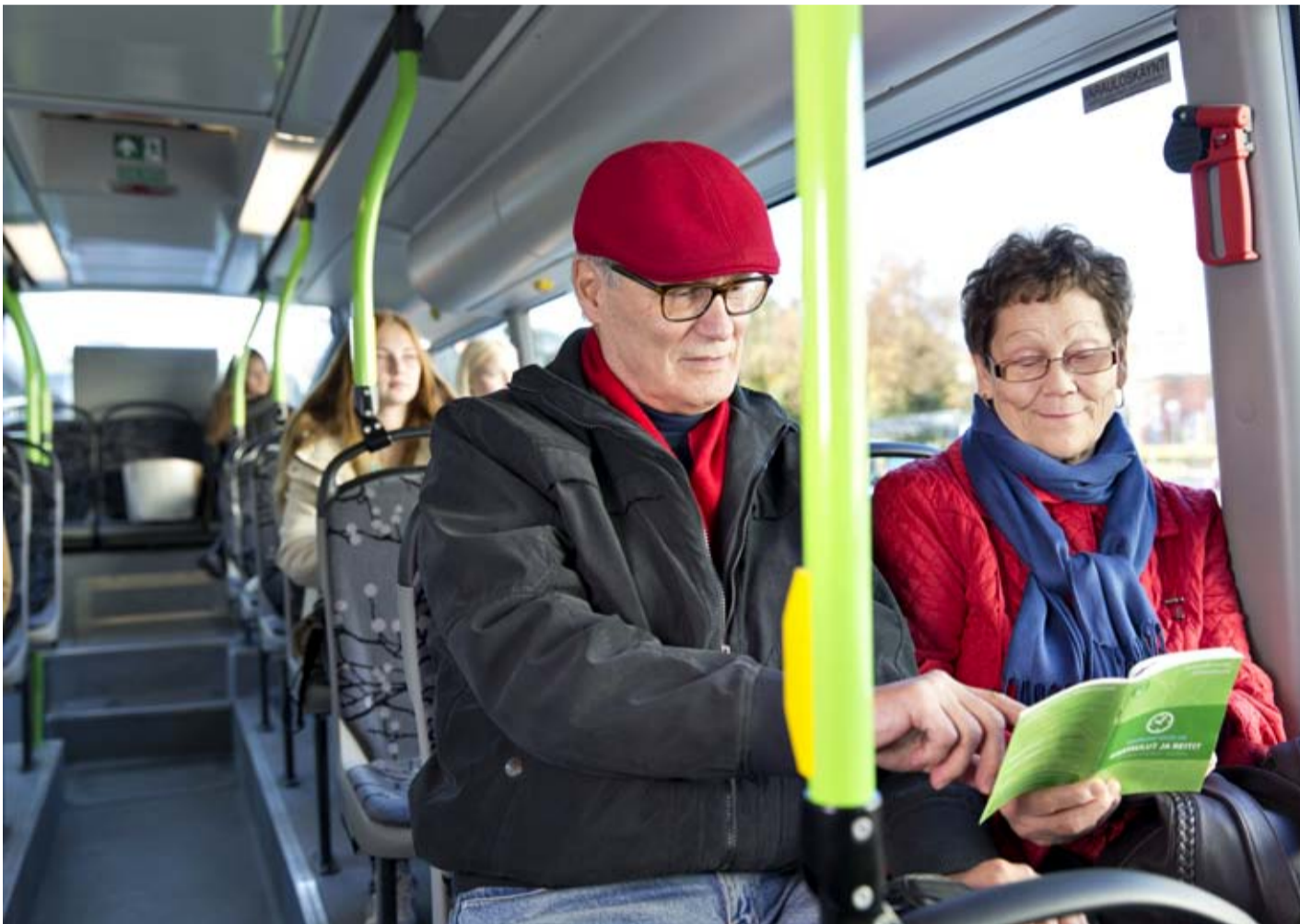
Linkkikummit voi pyytää opastusta ja neuvoja paikallisliikenteen palveluiden käyttämisessä.