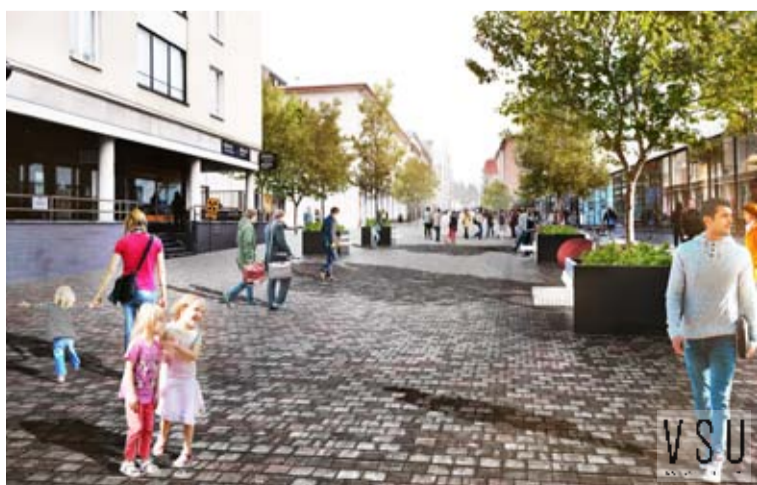
Suunnittelutoimiston havainnekuva siitä, miltä uudistetulla Väinönkadulla voisi jatkossa näyttää.