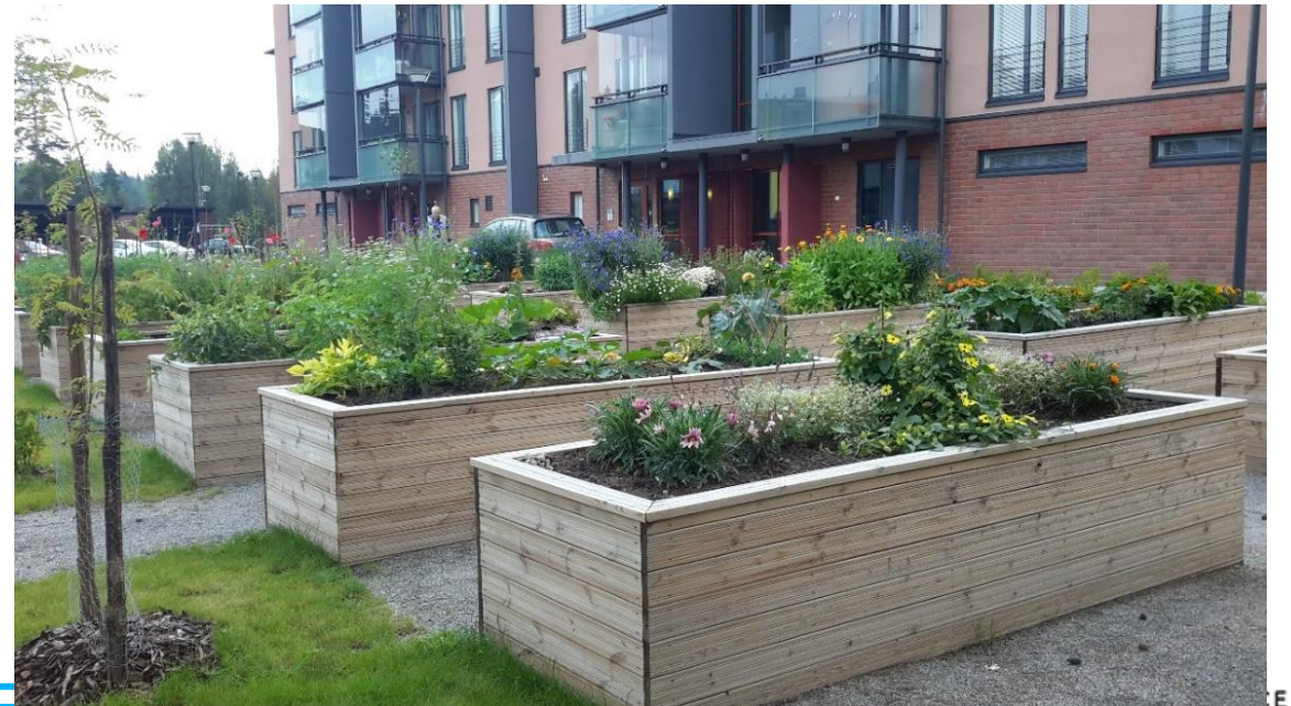
Viljelylaatikoita Ilona-talon pihalla, Huhtasuo, Jyväskylä

'...voi olla tekemässä ja menemässä yhdessä muiden kanssa. Toisaalta silloin kun haluaa toimintaa yksin tai puolison kanssa, voi tehdä niin.'