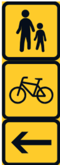
F52 Jalankulkija F50 Polkupyörä H2 Kohde nuolen suunnassa