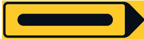
F15 Kiertotien viitta