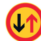
B4 Väistämisvelvollisuus kohdattaessa